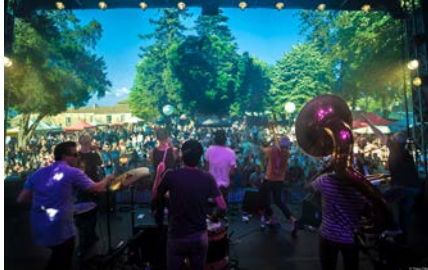
Get 7 Brass Band Fanfare cuivrée aux influences New Orleans et funky