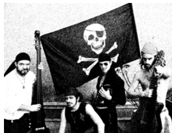
Les Pirates Chants et musiques énergiques, groupe issu de la compagnie des Branques...