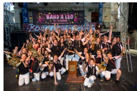
La Band'A Léo Championne de France et Palme d'or d'Europe 2017 des bandas 14/05/2017