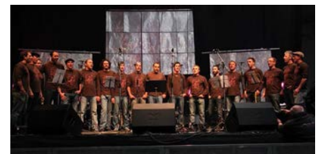
Los de Broussez- Chants occitans et espagnols