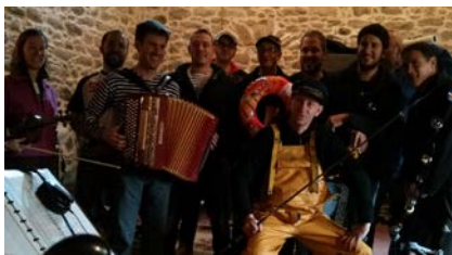
Et Vogue la Galère – Chants marins traditionnels