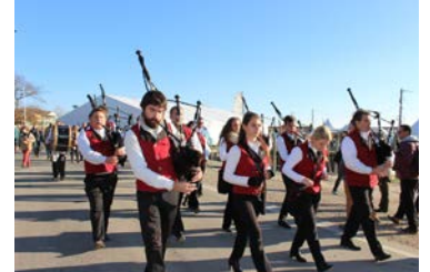
Bagad Ker Vourdel- Musique, marche, traditionnelles bretonnes