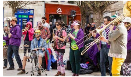
La Grasse Bande « Jeune fanfare du vieux Bordeaux » Disco Btp Distinction...