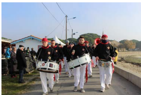
Los Calientes