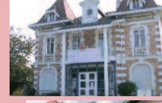
VILLA N°8 BIS

Actuellement le «poste de police municipale» abrita successivement, le musée jusqu'en 1985 et la Bibliothèque jusqu'en 1997.